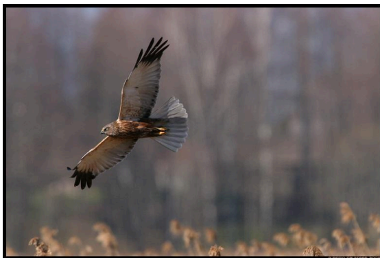
Joonis 2. Roo-loorkull (Savisaar, 2008)